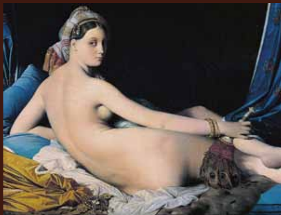
Ci-dessus: Jean-Auguste-Dominique Ingres, La Grande Odalisque (d tail), huile sur toile, 1814, Mus e du Louvre, Paris.