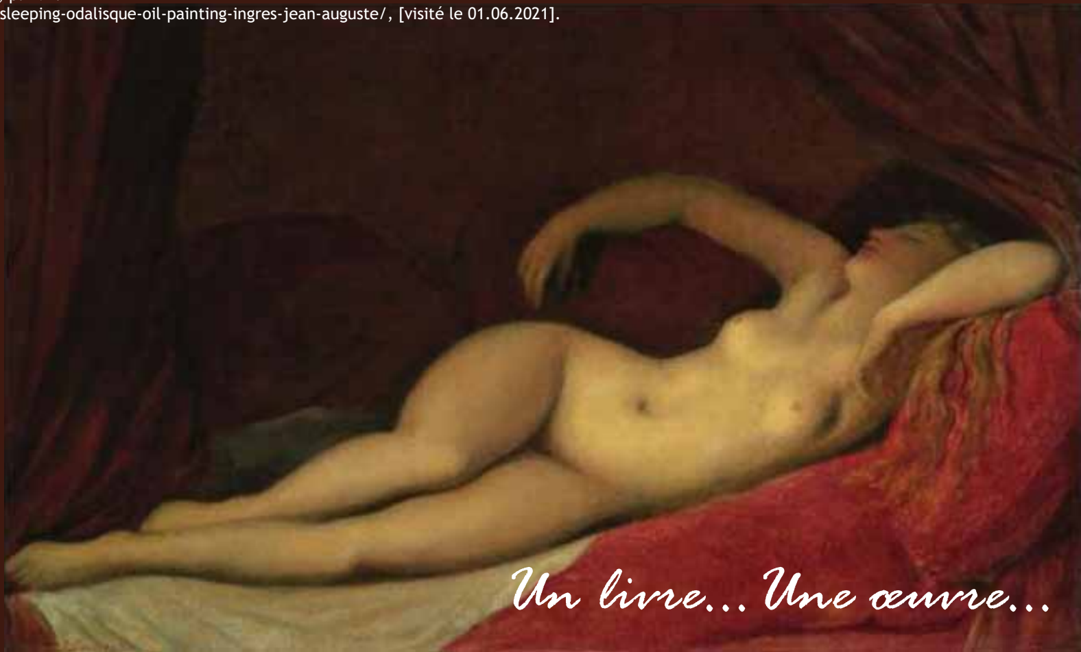
Droite: Jean-Auguste-Dominique Ingres, Odalisque dormant , huile sur toile, 1820, Victoria and Albert Museum, Londres.